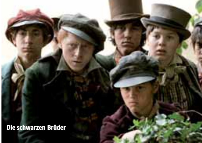
Die schwarzen Brüder