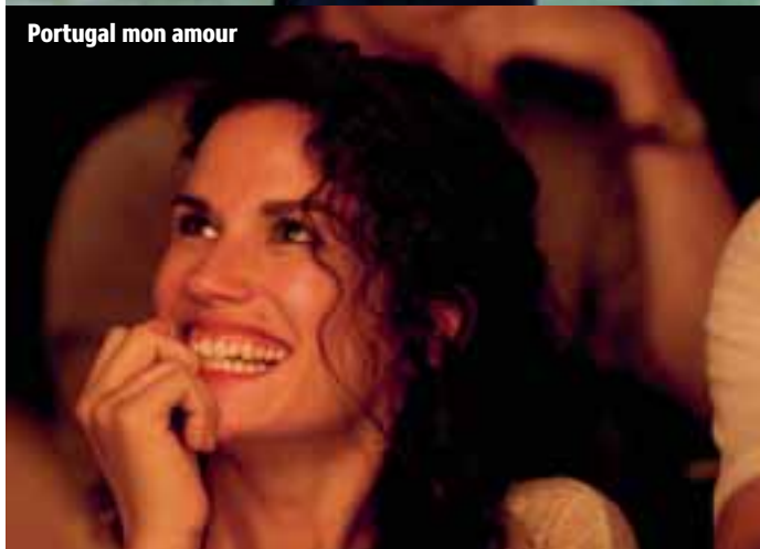
Portugal mon amour