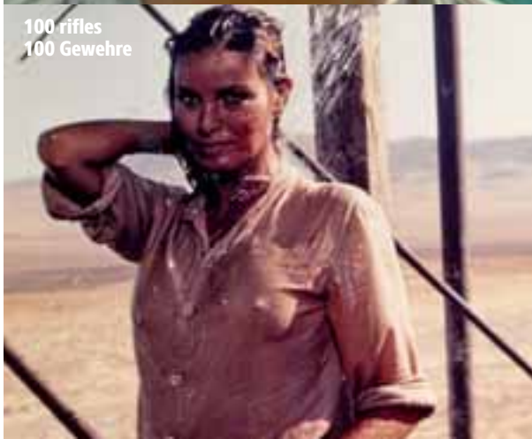
100 rifles 100 Gewehre