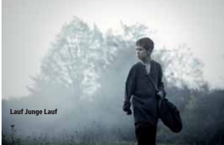
Lauf Junge Lauf