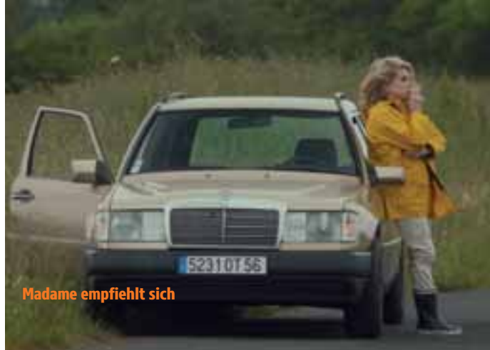
Madame empfiehlt sich

D/FR/IN/US 2013 104 Min. FSK ab 12 Jahren Regie: Ritesh Batra Darsteller: Nawazuddin Siddiqui, Nimrat Kaur, Irrfan Khan