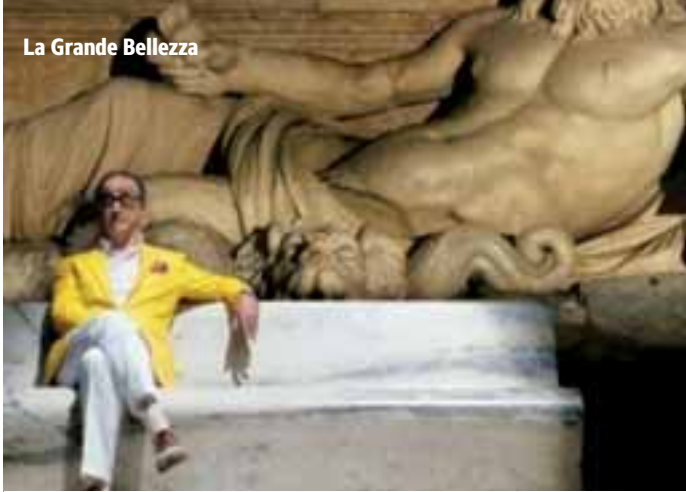
La Grande Bellezza

Termine Starnberg ab 20.03. Seefeld 30.03. 11:00 Uhr