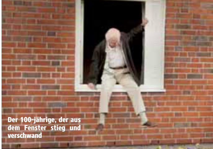
Der 100-jährige, der aus dem Fenster stieg und verschwand