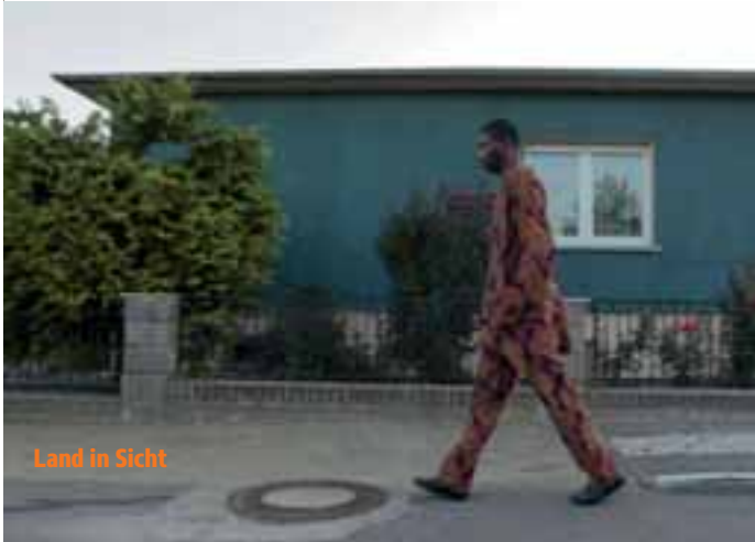
Land in Sicht