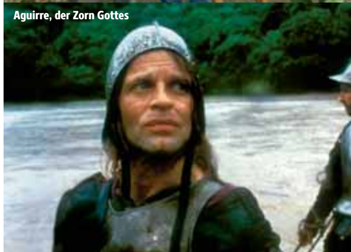
Aguirre, der Zorn Gottes