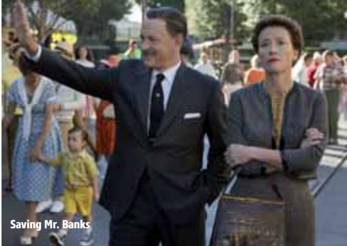
Saving Mr. Banks