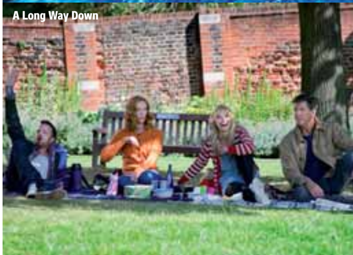
A Long Way Down