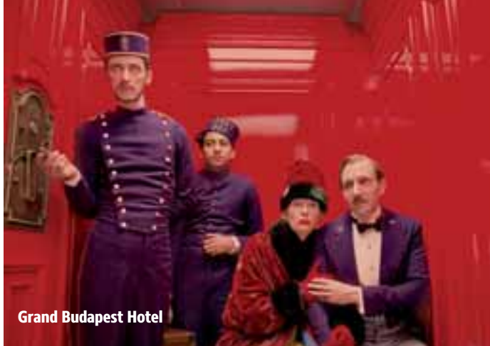
Grand Budapest Hotel