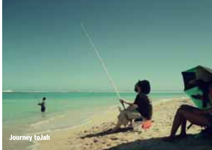
Journey to Jah

Termine Seefeld 25.04., 19:30 Uhr anschl. WELTKINOPARTY in der Kino-Lounge mit DJ Kairos