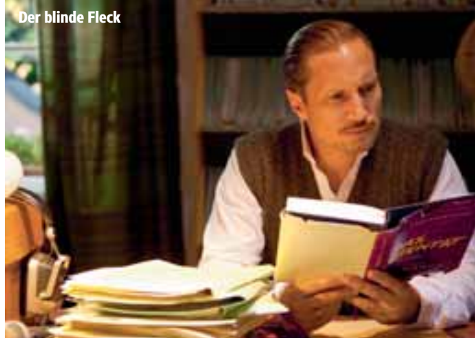
Der blinde Fleck