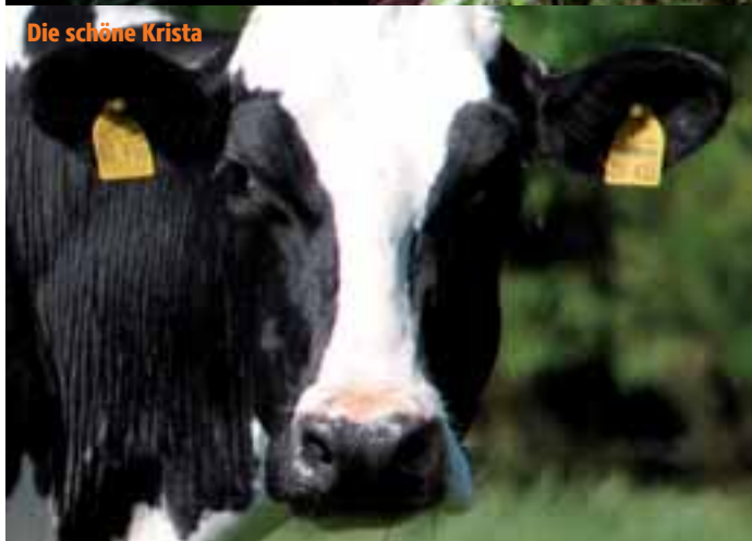
Die schöne Krista