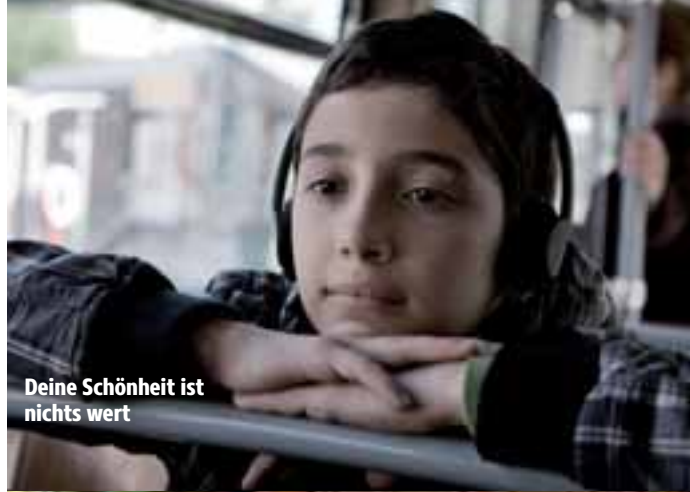
Deine Schönheit ist nichts wert

Termine Seefeld ab 03.04. Seefeld 13.04. 13:00 Uhr