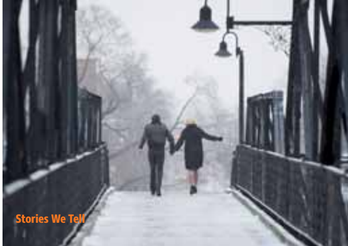
Stories We Tell