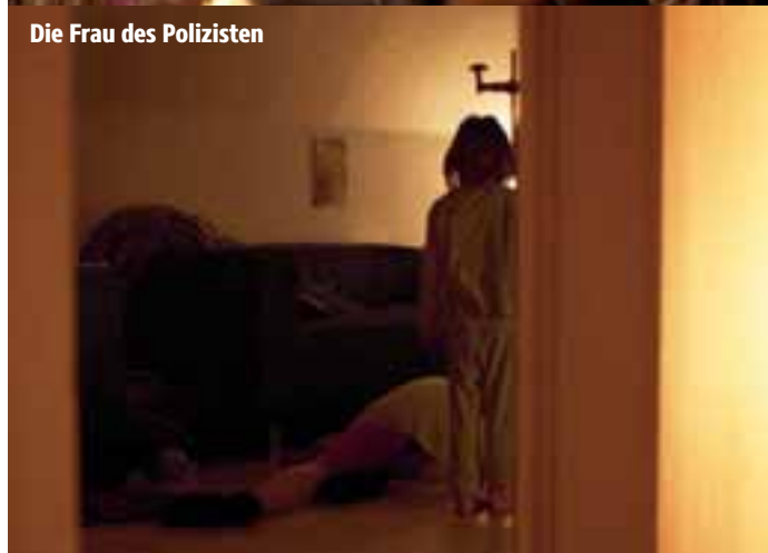
Die Frau des Polizisten