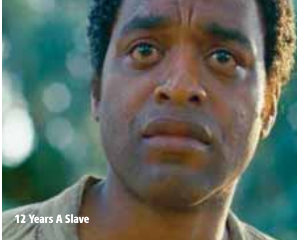
12 Years A Slave

Termine Seefeld 23.03. 11:00 Uhr Seefeld 18.04. 11:00 Uhr