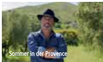
Sommer in der Provence

21:30 Uhr: OPEN AIR am Strandbad Starnberg und beim Augustiner am Wörthsee.