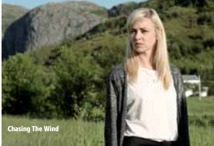
Chasing The Wind