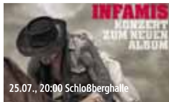
25.07., 20:00 Schloßberghalle

20:15 Uhr Seefeld TANGO IM KINO mit deutscher Erstaufführung: TANGO NEGRO